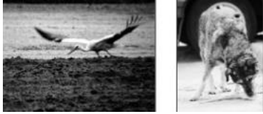
Zdjęcie bociana w locie i pies podczas posiłku – zdjęcia wykonane w efekcie podchodu.

Fotografia zwierząt czyli polowanie z aparatem fotograficznym uprawia wielu fotografów i fotoamatorów (bezkrwawe łowy). Jest to jeden z najbardziej pasjonujących rodzajów fotografii ale wymaga dużej specjalizacji - konieczna tu jest znajomość zarówno fotografii, jak i zwierząt. Polować z aparatem fotograficznym można wszędzie: we własnym ogródku, w polu i lesie, w afrykańskim buszu, amerykańskich sawannach. Rozróżniamy dwa sposoby polowania z aparatem fotograficznym: podchody i czaty.