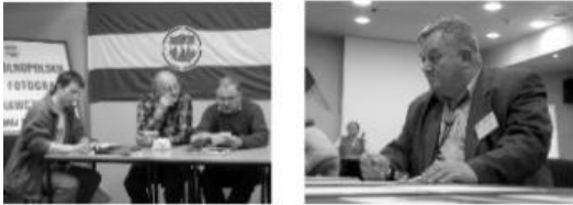
Zdjęcia reportażowe z konferencji podczas Forum Fotografii Krajoznawczej.

Reportaż dokumentalny - to taki, w którym fotograf jest, w pewnym sensie, oficjalnym świadkiem wydarzeń o charakterze lokalnym, narodowym, międzynarodowym mających miejsce w zasięgu jego obiektywu. Są to np. święta państwowe i kościelne, obchody rocznicowe, festiwale, festyny i wszystkie inne codzienne i uroczyste objawy zorganizowanego życia społecznego. Zagadnienia te od strony fotograficznej podzielić możemy na kilka typów: zebrania i konferencje. Zasadniczo jest to temat bardzo ubogi dla fotoreportera, toteż większość fotografów prasowych nie przejmując się ostatecznym wynikiem robi zdjęcia sposobem najprostszym, ale i najmniej ciekawym. Fotografuje prezydium i kilka fragmentów sali. Istotnie, z tematu dużo więcej wydobyć nie można, chyba że ma miejsce jakieś specjalne wydarzenie, ale są to bardzo rzadkie przypadki (chyba, że fotograf ma wyjątkowy zmysł obserwacji).