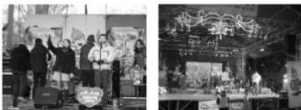
Zdjęcia z uroczystości masowych (koncert Wielkiej Orkiestry Świątecznej Pomocy)

Inne uroczystości masowe, jak np.: dożynki, festyny, widowiska uliczne. Najlepiej jest jeżeli fotograf ma swobodę poruszania się. Może wtedy wybierać z dużych zespołów interesujące go fragmenty, może stosować zbliżenia znacznie ułatwiające mu ciekawsze ujęcia. Powodzenie w czasie fotografowania takich wydarzeń, zapewni mały rekonesans. Przygotowując się do fotografowania wydarzenia odbywającego się na wolnym powietrzu, dobrze jest dzień lub dwa dni wcześniej przejść trasę, na której będzie się ono odbywać i zastanowić się nad miejscami, z których będzie można fotografować. Dobrze jest przyjrzeć się, w których miejscach można wejść trochę wyżej, by móc fotografować ponad głowami tłumu. Może do tego posłużyć solidny murek ceglany, na który łatwo będzie się wspiąć, albo okno na pierwszym piętrze budynku, z którego widać trasę (zakładając, że ma się pozwolenie do wejścia na teren prywatny).