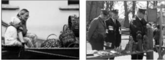
Zdjęcia scen rodzajowych.

Sceny rodzajowe są interesujące dla osób lubiących zmienne i barwne aspekty codziennego życia. Temat taki znajdzie się wszędzie tam, gdzie bywa fotograf: targ, ruchliwa ulica, życie na wsi, szkoła. W czasie spaceru po mieście, podczas pobytu w nieznannej okolicy fotografa interesują nie tylko zabytki historyczne, pomniki i krajobraz, lecz również mieszkańcy tego regionu, ich praca, rozrywki. Zdjęcia tego typu ukazują wielorakie aspekty życia codziennego. Do wykonania takich zdjęć wcale nie trzeba odbywać dalekich podróży, można je wykonać na każdym rogu ulicy. Reportaż tego typu polega na chwytaniu w lot drobnych, zabawnych, wzruszających czy malowniczych scen. Najlepszym sposobem zrobienia drobnych zdjęć jest zmieszanie się z tłumem, fotograf powinien stać się bezimiennym jednym z wielu przechodniem podpatrującym codzienne życie innych ludzi.