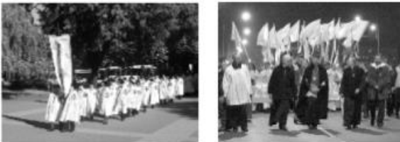
Zdjęcia reportażowe z procesji.

Wszelkiego rodzaju pochody uliczne (marsze, procesje.). Są to akcje zorganizowane, dostępne dla wszystkich fotografujących. Znając charakter takich powtarzających się często uroczystości można z góry przewidzieć, co i gdzie się będzie działo, można więc znaleźć najlepszy punkt widzenia, tak pod względem oświetlenia jak i ujęcia tematu. Są to widowiska dekoracyjne i wielobarwne, dlatego warto je fotografować na materiale barwnym.